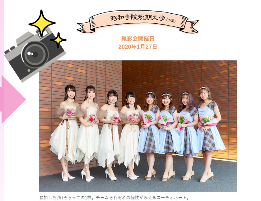
参加した2組そろっての1枚。チームそれぞれの個性がみえるコーディネート。

コンセプトシートを使用してドレスの企画 ブライダル総研の社員の方からポイントを 講座でレクチャーしてもらいました。